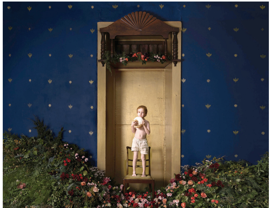
Jennifer Thoreson, Portrait of Caspian (detail) , 2023, photograph on fiber rag / fotografía en papel fiber rag 20 x 30 inches / 50.8 x 76.2 centímetros

Cover: Lynnette Haozous, Walks with the sun / Paseos con el sol , 2023, site-specific mural, latex paint on wall, commissioned by 516 ARTS / mural específico del sitio, pintura de látex en la pared, encargado por 516 ARTS, 21 x 17.7 feet / 6.4 x 5.4 metros